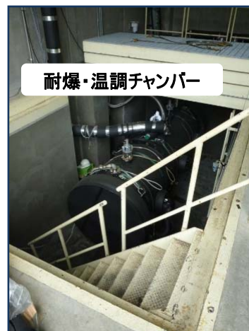
耐爆・温調チャンバー