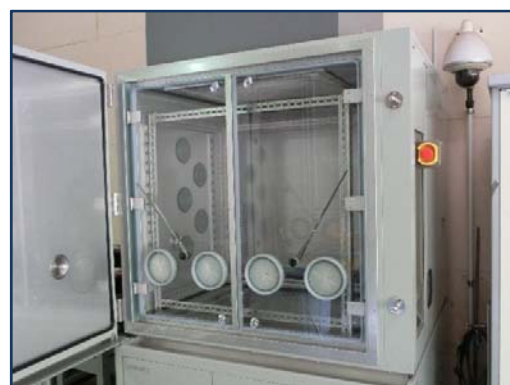
超低温恒温恒湿槽(-70~150°C)