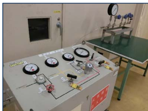
ガスブースター装置(110MPa)