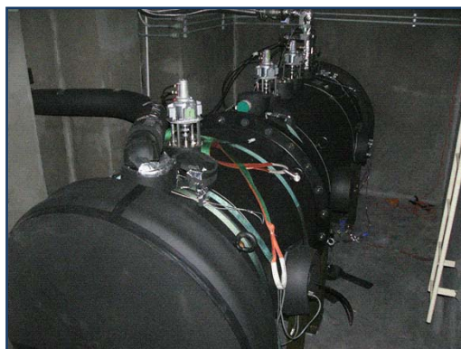
耐爆・温調チャンバー